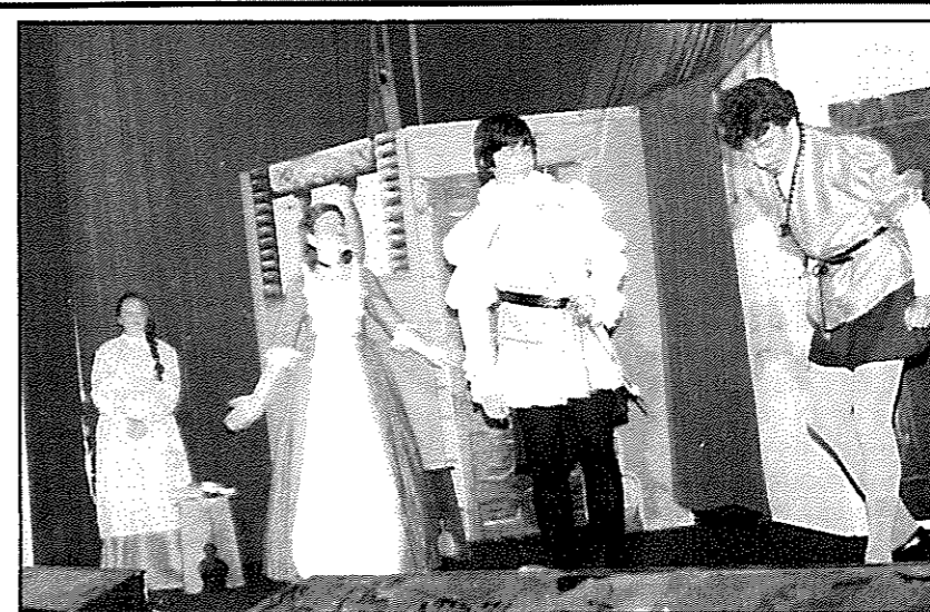
Una escena de "La niña de plata", de Lope de Vega, representada en la capital de Teruel, por el Centro Cultural Recreativo de Ulldecona, que participó en el "Segundo encuentro Nacional Juvenil de Teatro Clásico"